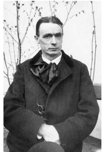
Rudolf Steiner i Norge 1908.