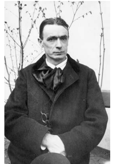
Rudolf Steiner i Norge 1908.